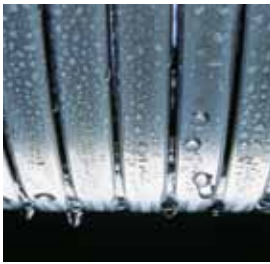
Inox-Radial-Wärmetauscher – langlebig und effizient