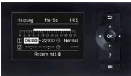
Vitotronic Regelung – klare Anzeige der Schaltzeiten